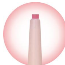
繰り出しタイプの 1.5mmの極細芯