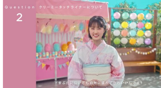
下まぶたに引いても自然に盛れてかわいいんです！

描きたいラインを思いのままに描けちゃうんです。さらに濃厚発色で落ちにくい！良いことづくめですね。普段ペンシルアイライナーを使っている方にはもちろん、リキッドアイライナー派の方にもぜひおすすめしたいです！