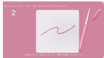
先ほど少しお話ししました17番が仲間入りしました！