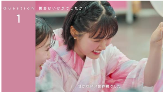
甘かわいい世界観でした