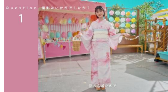
浴衣姿がかわいい原さん♡

目元に新色を仕込み、夏祭りを楽しむCMになっています。 ピンクのヨーヨーやわたあめがあって、甘かわいい世界観でした！ 浴衣も着たので、本当の夏祭りかのように楽しむことができました♡