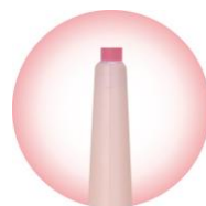
繰り出しタイプの 1.5mmの極細芯