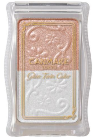
No.05 新色 ピンクベージュパール