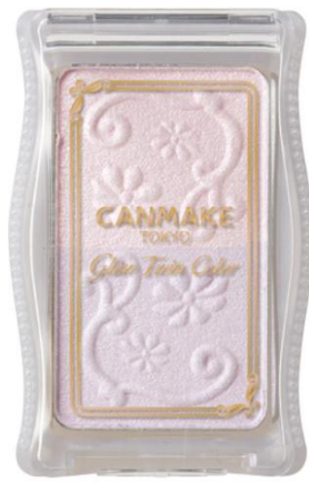
No.04 サクララベンダー