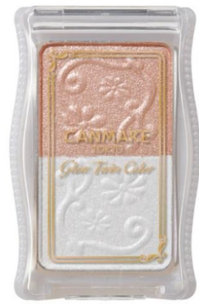
No.05 新色 ピンクベージュパール

No.01 ホワイトベージュ : しっかり立体感を出す黄味系ホワイト×肌馴染みの良いオレンジベージュ