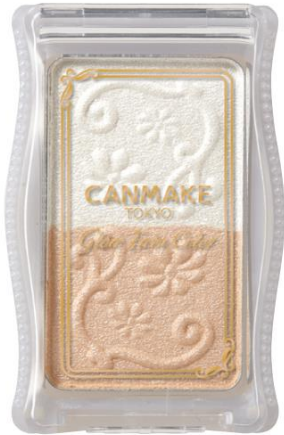
No.01 ホワイトベージュ