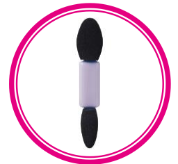
ダブルエンドチップ付