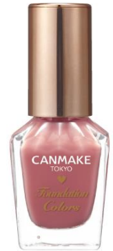
01 ナチュラルピンク 自然な美爪に見せる、ネイル用ファンデーション。 血色感をプラスするシアーピンク色。