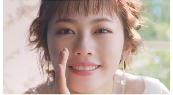
4.「使わないなんてもったいない」