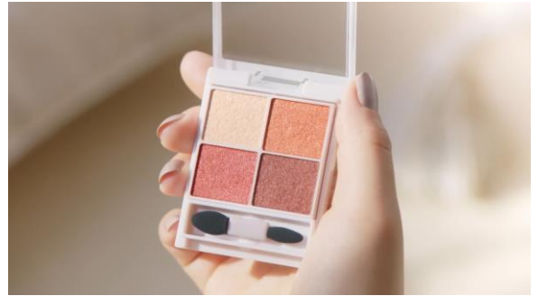
2.それはなめらかリッチな4色アイシャドウ