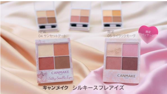
5.「シルキースフレアイズに新色出たよ」