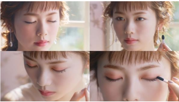
3.透け感と上品なツヤがふわっと重なりピタッと密着