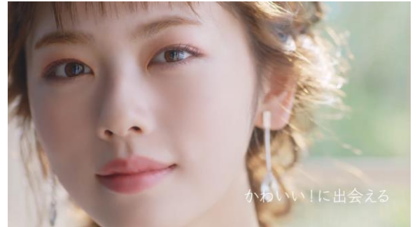
6.「かわいい!に出会える キャンメイクトーチョー」