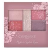
パーフェクトスタイリストアイズ 14

マスカラは、カール&キープ効果の「クイックラッシュカーラー」のブラウンをチョイス。上品で華やかなぱっちり目もとに仕上がります。