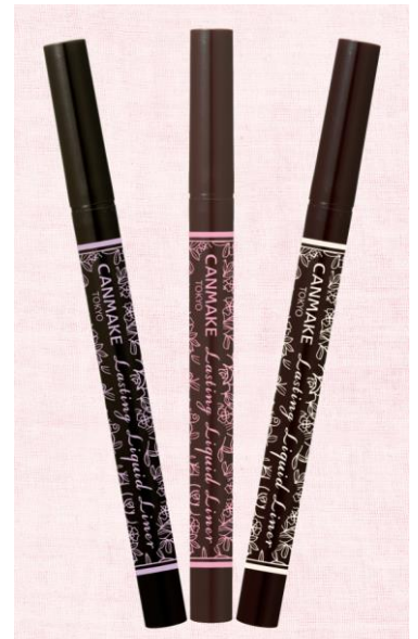
左) 01 ブラック (しっかり目元を引き締める)