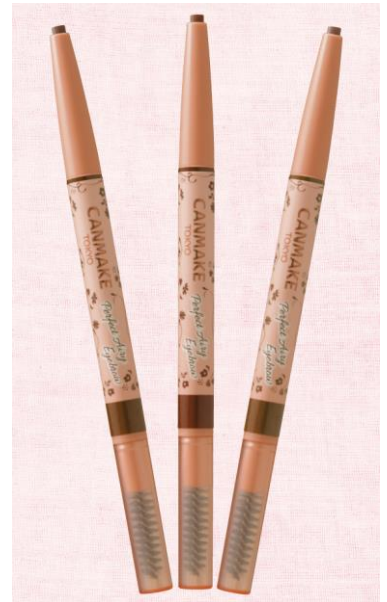
左) 01 ビターブラウン (黒髪や暗めの髪色向け)