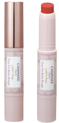
「ステイオンバームルージュ」 新色 20 コットンピオニー

株式会社井田ラボラトリーズ（本部：東京都千代田区、代表取締役社長：井田 仁幸）は、かわいい・リーズナブル・高品質な商品でキレイを応援するメイクアップブランドCANMAKEから、ふんわり眉が1本で描ける新作アイブロウ「パーフェクトエアリーアイブロウ」をはじめ、「シルキースフレアイズ」「ラスティングリキッドライナー」「ステイオンバームルージュ」の新色を2021年2月下旬より発売いたします。