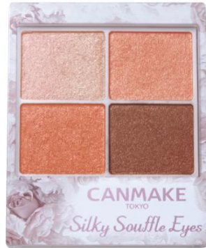
「シルキースフレアイズ」 新色 07 ネクタリンオレンジ