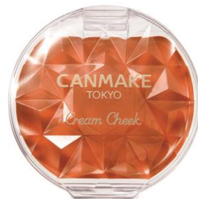
22みかんシャーベット