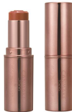
T07ジンジャーオレンジ

※店舗様によって陳列開始日が異なる為、発売日の表記は「1月下旬」でお願いいたします。