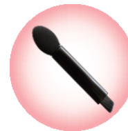
なめらかな上質チップ 涙袋の影も描ける斜めブラシ