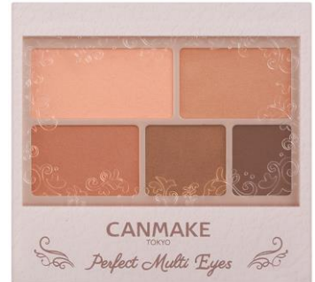
07 ウィークエンドオレンジ