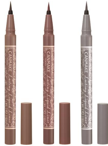
(左から) 05 グレージュ 06 ローズグレージュ 07 ミルクブルージュ