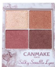
04 サンセットデート