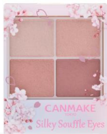
10 スウィートラブレター