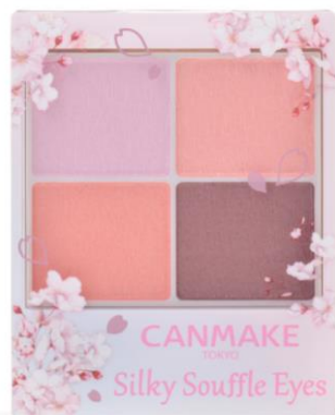
〈限定 桜パッケージ〉 11ブロッサムシャワー