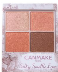
07 ネクタリンオレンジ