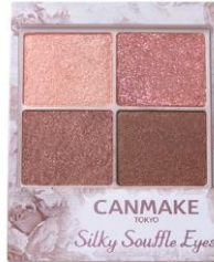
08 ストロベリーコッパー