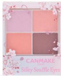
&lt;限定色&gt; 11 ブロッサムシャワー