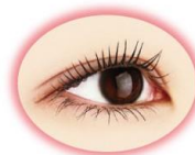
一度塗り ピュアルック