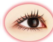
更に重ね塗り アイドルック