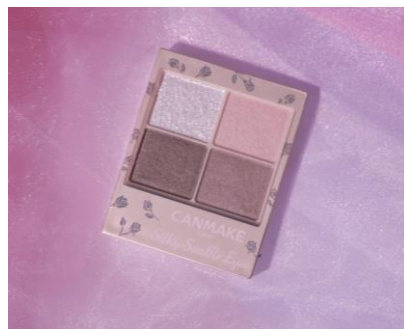
M07 チュチュバレリーナ

バレリーナの衣装を思わせる、ふんわりとしたやわらかなピンクを表現して「チュチュバレリーナ」と名付けました♡