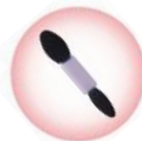
なめらかな ダブルエンドチップ