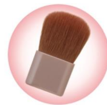
毛量たっぷり！ ふわふわのブラシ付き