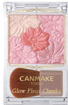
17 いちごミルクフルール