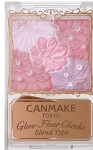
B03 ラベンダードリーム