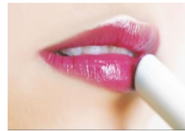
仕上がりイメージ