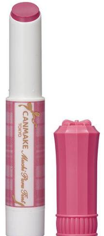
06 ラズベリーケーキ