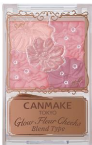
B01 コットンコーラル