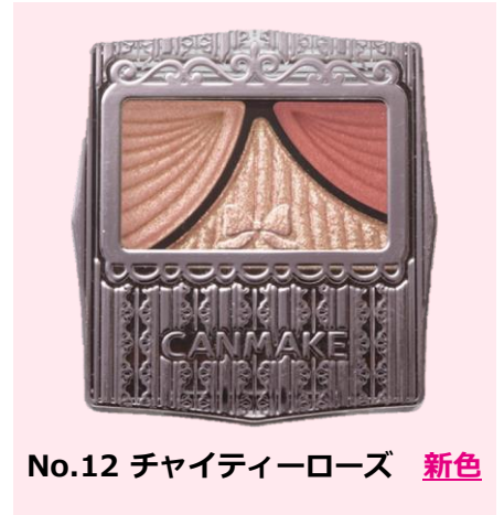
No.12 チャイティーローズ 新色