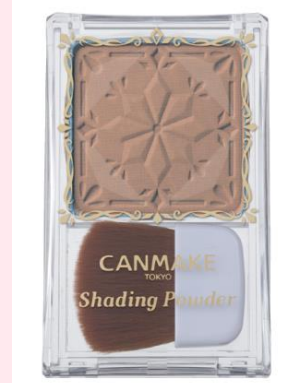
新色 No.05 ムーングレンジ

鉱物油フリー、石油系界面活性剤フリー、タル系色素フリー、紫外線吸収剤フリー、無香料