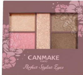
10 スウィートフラミンゴ 優しく甘いフェミニンカラー