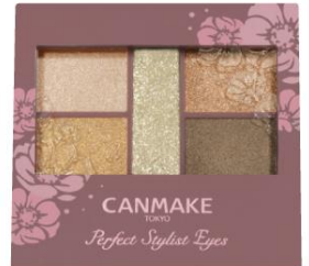
16 ダブルサンシャイン 輝きを散りばめたヘルシーカラー