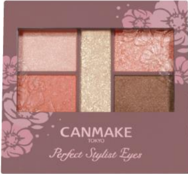
新色 22 アプリコットピーチ ピンク×オレンジニュアンスのコーラル