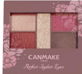
14 アンティークルビー 上品さと色気を兼ね備えた クラシックカラー