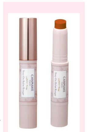
新色 No.18 ブラウニッシュマンダリン