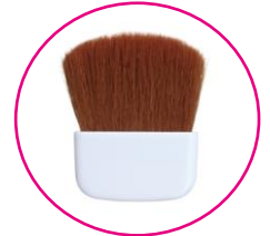
毛量たっぷり 柔らかなナイロンブラシ