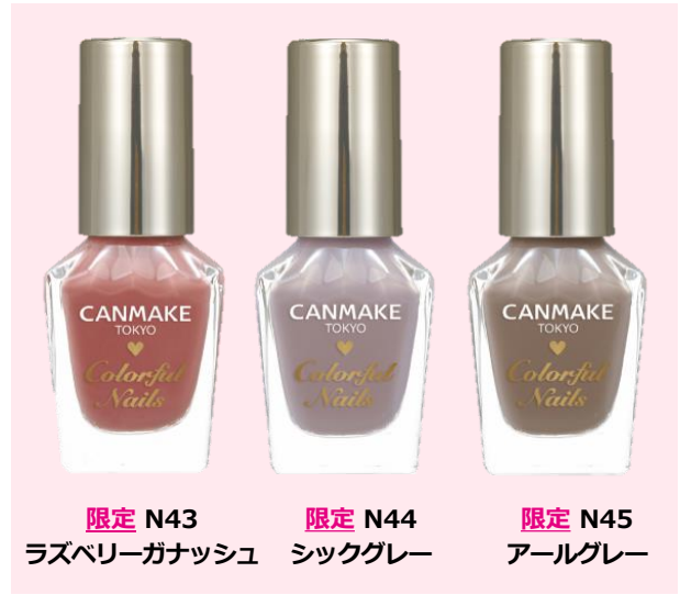
限定 N43 ラズベリーガナッシュ 限定 N44 シックグレー 限定 N45 アールグレー