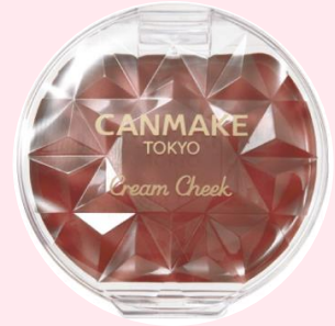
限定 20 ビターチョコレート