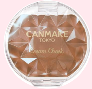
限定 19 シナモンミルクティー