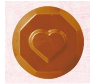
限定色「メルティールミナスルーージュ」T05