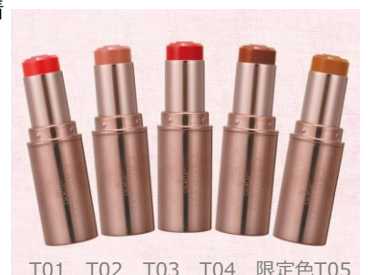
T01 T02 T03 T04 限定色T05