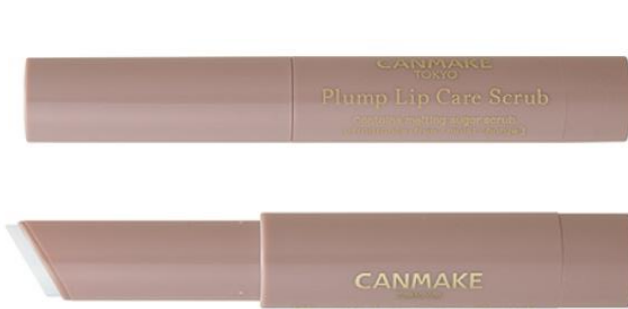
「プランプリップケアスクラブ」