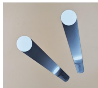
マジック・トーチ

特長は、付属のマジック・トーチを使うと暗闇に隠れたさまざまな動物たちが浮き上がる不思議なしかけ。そして夜・月・星などの睡眠を連想させる単語と、繰り返されるおやすみのフレーズが小さな読者たちを優しい眠りに誘うおやすみ絵本としての効果です。