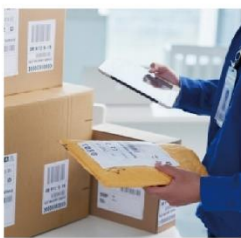
海外駐在員サポート 「CLUB JAPAN」事業

「世界で暮らす人々に良質な商品を提供し、より豊かな人生に貢献する」を掲げ、海外駐在員に生活物資を届けるサービス「CLUB JAPAN」や、輸出・輸入卸売事業、出版流通代行業などを展開してきました。2023年6月出版レーベル「ヴォワリエブックス」を立ち上げ中華古風BL『千秋』日本語版を発売したり、2024年8月世界の“しかけ絵本”の日本語版を出版する新レーベル「lilla cirkus（リラ・シルクス）」も立ち上げたりするなど、新しい試みにも挑戦しています。