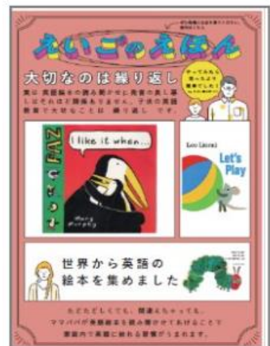
△誘導 POP イメージ