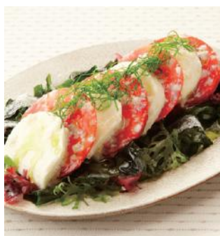
【塩麹の美カプレーゼ】