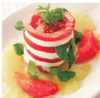
【グレープフルーツとビネガーの 美カプレーゼ】