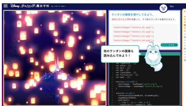
キャラクターが会話形式で学習すべきことをナビゲート