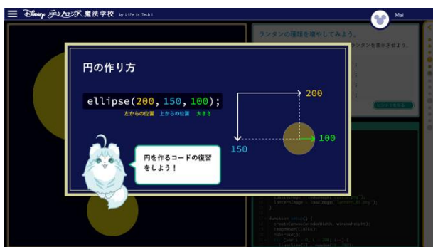
レクチャー部分はわかりやすく図解