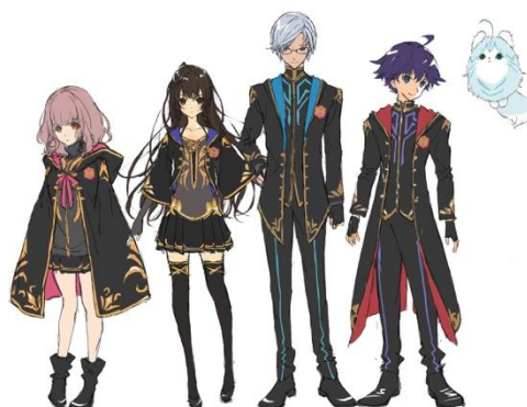
個性豊かなオリジナルキャラクター