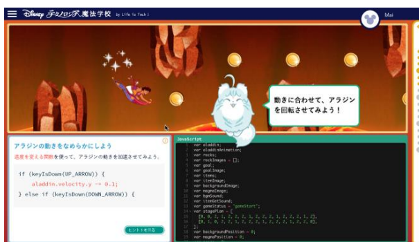
適切な学習情報量や柔軟なレイアウトで 初心者でもストレスなく学習可能