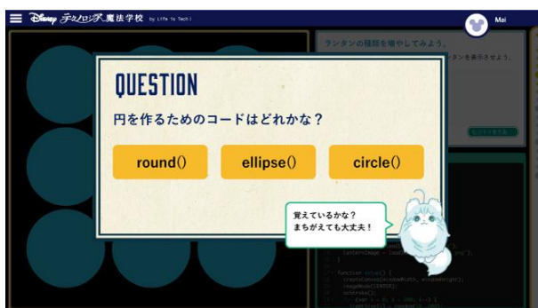
クイズ形式で理解度を確認