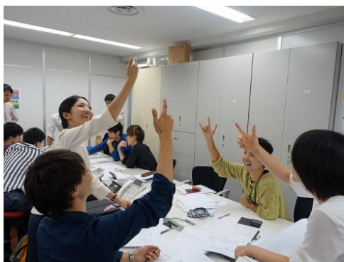
2015年のインターンシップの様様

このインターンシップは全 6 回開催され、学生がチームに分かれて戸建住宅の設計プランを作成し、コンペ形式で競い合うものです。各回の優秀作品 1 点が 10 月に行われる Grand FINAL(決勝戦)に進み、これを勝ち抜いた学生の設計プラン 1 作品を、オープンハウスグループが実際に建築・販売をいたします。