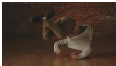
練習のときもコンタクトを装着している。