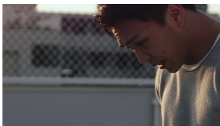
ダンスにおいて、彼は人一倍の練習をして、 努力を重ねてきた。