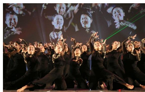
2017年ビッグクラス優勝 同志社香里高等学校（大阪）