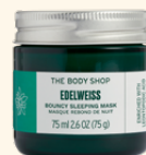
＜夜用保湿マスク＞ EDW バウンシィ スリーピングマスク 75mL 5,830円

薄くデリケートな目元に潤いを与え、ピンとハリのある目元に導く目元用クリーム。2種のエーデルワイスエキス ※1 の美容成分や、セラミドNPなどの保湿成分を配合し、ひんやりとしたジェリーのようなテクスチャーで目元をリフレッシュします。