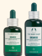
＜美容液＞ EDW コンセントレートセラム 30mL 6,270円 50mL 8,360円

過酷な環境でも生き抜くエーデルワイスエキス ※1 を配合した自然由来成分96%配合の美容液ミスト。ジェル状からミストへ変化するユニークなテクスチャーが肌にピタッと密着し、肌にしなやかさを与えます。