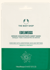
＜シート状マスク＞ EDW セラムシートマスク 21mL 990円

過酷な環境でも生き抜くエーデルワイスエキス ※1 を濃密 ※4 に配合した自然由来成分99%配合の美容液シートマスク。美容成分を角質層のすみずみまで集中的に届け、うるおいに満ちたハリのある肌へ導きます。