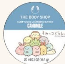
サンプチュアス クレンジングバター CA 20mL 1,000円