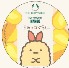
ボディヨーグルト MG 200mL 2,750円

南国を思わせるトロピカルなマンゴーの香り。サラッと肌と魅惑の香りで、ジメジメした季節を軽やかに乗り越えるのにピッタリです。