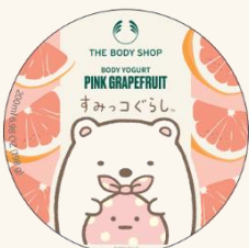
ボディヨーグルト PG 200mL 2,750円

ひんやりとみずみずしいテクスチャーのジェルクリームが魅力のボディヨーグルト。使用後はベタつかないので、すぐに洋服を着ることができる優れものです。