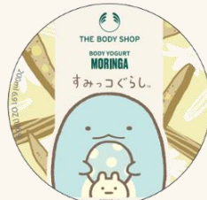
ボディヨーグルト MO 200mL 2,750円

モリンガの花をベースとした華やかな香りが魅力のモリンガ。ホワイトフローラルな香りなので、イベントやデート前の保湿ケアにも。