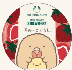
ボディヨーグルト ST 200mL 2,750円

ジューシーな香りで気分を明るく盛り上げてくれるストロベリー。お出かけ前に活用して、ウキウキしたうおう肌で夏を楽しみましょう。