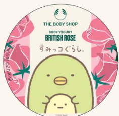
ボディヨーグルト BR 200mL 2,750円

摘みたてローズのような優美な香りが漂うブリティッシュローズ。1日の終わりのリラックスタイムに寄り添ってくれる秀逸なアイテムです。