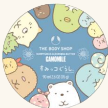
サンプチュアス クレンジングバター CA 90mL 3,080円

手のひらの体温でじんわりと解けていく様がたまらない、カモマイル クレンジングバター。しっとりモチモチとした洗い上がりにリピーターが多い人気定番製品です。