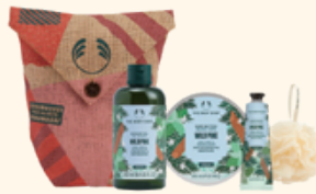
ホリデーボディケアバッグ ワイルドPI 5,940円 <セット内容> ・シャワージェル 250mL ・ボディバター 200mL ・ハンドバーム 30mL ・バスリリー ミニ