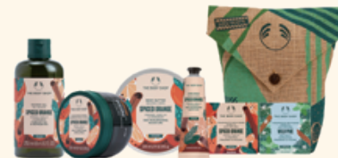
ホリデー総コレクション スパイスドORG 9,625円 <セット内容> ・シャワージェル 250mL ・ボディバター 200mL ・ハンドバーム 30mL ・ボディスクラブ 250mL ・バスボム(スパイスドオレンジ/ワイルドパイン)各 50g