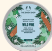
ボディバター ワイルドPI 200mL 3,410円