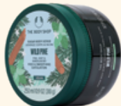
ボディスクラブ ワイルドPI 250mL 3,300円