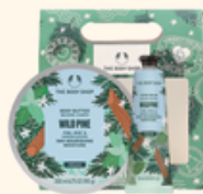
ホリデーボディケアアセット ワイルドPI 4,340円 <セット内容> ・ハンドバーム 30mL ・ボディバター 200mL