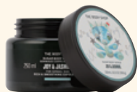
ボディスクラブ JSM 250mL 3,300円