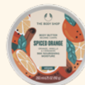
ボディバター スパイスドオレンジ 200mL 3,410円