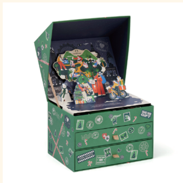
アドベントカレンダー ウィッシュ&ワンダー 21,500円

持ち運びにも便利なミニサイズのボディケアアイテムにヘアケア、シートマスクなどのスペシャルフェイスクアアイテムが25日分入った、ワンダーの詰まったアドベントカレンダーです。