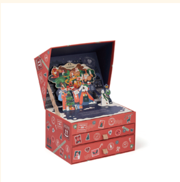
アドベントカレンダー ワンダー 13,200円

パッケージにはコミュニティフェアトレード先のストーリーが描かれ、より公正な世界への希望と願いが込められています。買うこと、使うことで、世界中のパートナーにも笑顔をつくる、ワンダーでスペシャルな心温まる2種のアドベントカレンダー。使用し終わった後のボックスは、小物入れとして使うのもおすすめです。