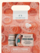
発売日調整中 ホリデーミニボディケアギフト スパイスドORG 2,420円 <セット内容> ・シャワージェル 60mL ・ボディバター 50mL ・バスリリーラミー ミニ