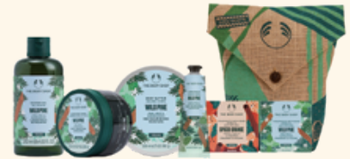
ホリデー TOTAL コレクション ワイルドPI 9,625円 <セット内容> ・シャワージェル 250mL ・ボディバター 200mL ・ハンドバーム 30mL ・ボディスクラブ 250mL ・バスボム (スパイスドオレンジ / ワイルドパイン) 各 50g