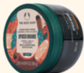
ボディスクラブ スパイスドORG 250mL 3,300円