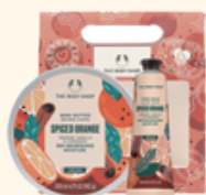
ホリデーボディケアセット スパイスドORG 4,340円 <セット内容> ・ハンドバーム 30mL ・ボディバター 200mL