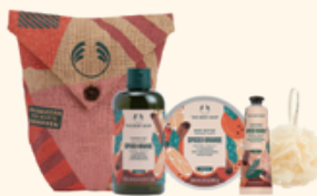
ホリデーボディケアバッグ スパイスドORG 5,940円 <セット内容> ・シャワージェル 250mL ・ボディバター 200mL ・ハンドバーム 30mL ・バスリリー ミニ