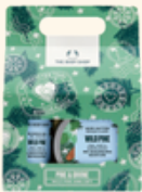
発売日調整中 ホリデーミニボディケアギフト ワイルドPI 2,420円 <セット内容> ・シャワージェル 60mL ・ボディバター 50mL ・バスリリーラミー ミニ