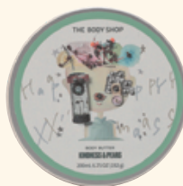
ボディバター PE 200mL 3,410円