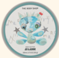
ボディバター JSM 200mL 3,410円