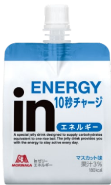
▲ i nゼリー