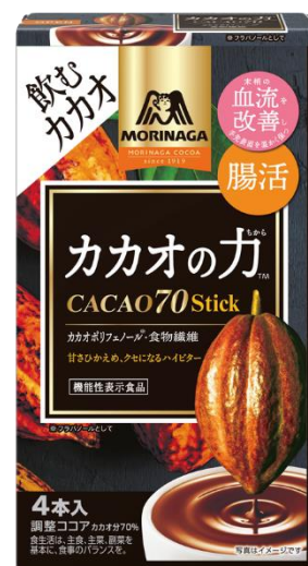
カカオの力 <CACAO70> スティック