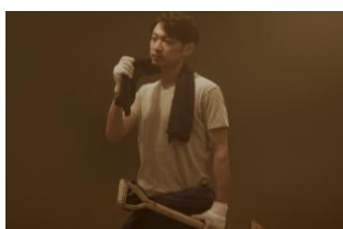
職業：農園経営 年齢：32歳