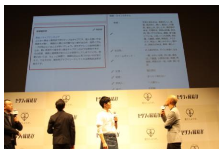
▲小峠さんのゼクシィ縁結びプロフィール