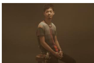
職業：美容師 年齢：28歳

実際に皆さんは『ゼクシィ縁結び』のサービスを利用してパートナーを探しています。20～30代の様々な職種の方たちに出演のご協力をいただきました。