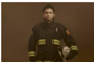
職業：消防士 年齢：30歳