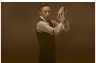
職業：飲食店店長 年齢：33歳