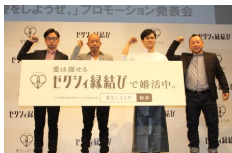
▲「愛をしようぜ。」宣言