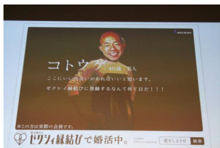
▲小峠さん自作のポスター写真