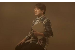
職業：システムエンジニア 年齢：39歳