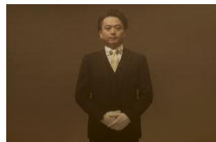
職業：運転手 年齢：33歳