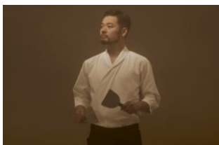
職業：料理人 年齢：32歳