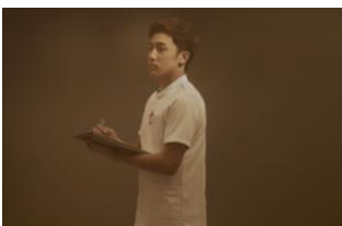
職業：診療放射線技師 年齢：23歳