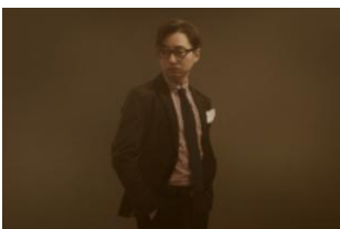
職業：アパレル会社員 年齢：38歳