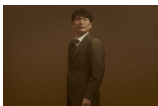
職業：不動産業会社員 年齢：28歳