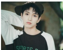
IO (イオ) 2007/1/25 生まれ。 京都府出身。

【VIBY 公式 Instagram】 https://www.instagram.com/official_viby/