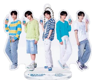
▲賞品画像はイメージです。