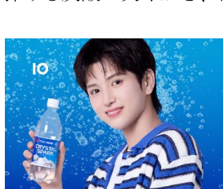
▲CRYSTAL SPARK プレーン 500ml

CRYSTAL SPARK は、心地よい強炭酸と、糖分を気にせず楽しめる無糖のスッキリとした爽やかな味わい、華やかな香りを追求した炭酸水ブランドです。ブランド名には、水のきらめきや輝き、爽やかに弾ける炭酸の爽やかさ、毎日の暮らしに煌めきを添えたいといった思いが込められています。