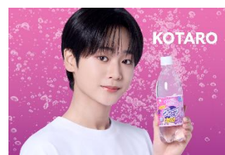
▲CRYSTAL SPARK グレープソーダ 500ml