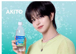
▲CRYSTAL SPARK シャインマスカット 500ml