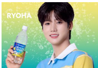
▲CRYSTAL SPARK レモン 500ml