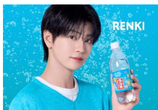
▲CRYSTAL SPARK ラムネ 500ml