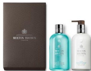
サイプレス&シーフェネル ボディケアギフトセット (公式オンラインストア限定)

モルトンブラウン公式オンラインストアでは、おすすめ製品を組み合わせせたセット品をご用意しています。また通常品から組み合わせせてギフトボックスやバッグでカスタムすることもできます。多様なギフトニーズに応えるラインアップをご用意しておりますので、ぜひお試しください。