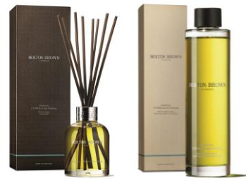
ホームフレグランス