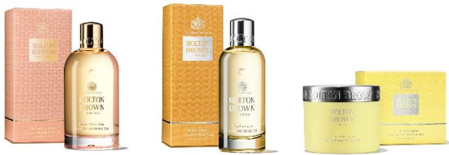
バス&ボディスPECIALケア