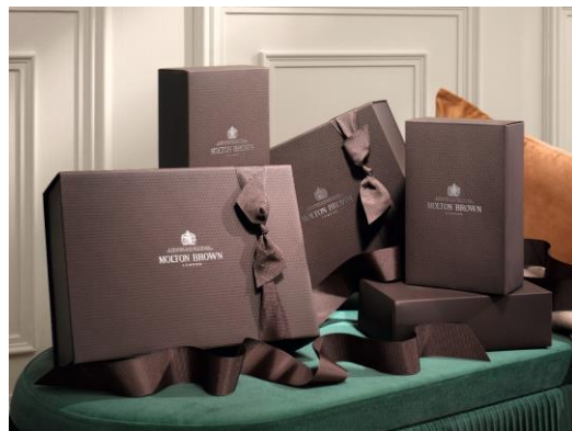
ギフトボックス イメージ

ギフトボックスとバッグは、モルトンブラウンの伝統的な色調“メイフェア エボニー”カラーにコンパスのパターン模様がデボス加工で施された、どんなギフトシーンにもマッチする上品で美しいデザインです。