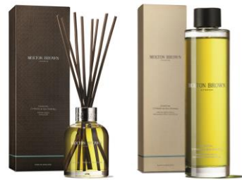
ホームフレグランス