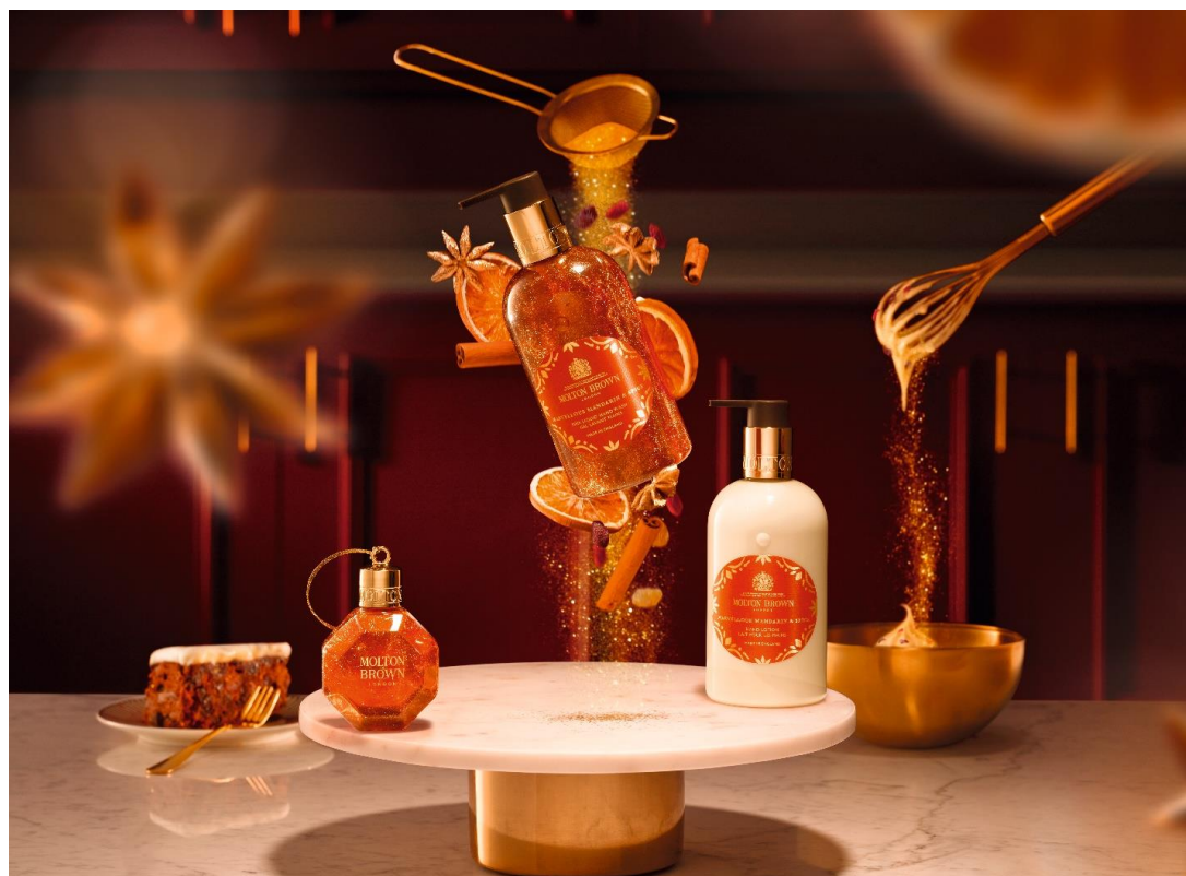
「マーヴェラス マンダリン&スパイス」イメージ

英国のフレグランスブランド「モルトンブラウン」は、「マーヴェラス マンダリン&スパイス」をはじめとするホリデイシーズン限定フレグランスとアドベントカレンダーを2023年11月1日（水）*に発売いたします。