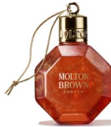
バス&シャワージェル フェスティブボーブル 75ml/価格：2,750円 (税抜：2,500円) ※11月15日(水)発売