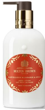
ハンドローション 300ml/価格：4,950円 (税抜：4,500円)