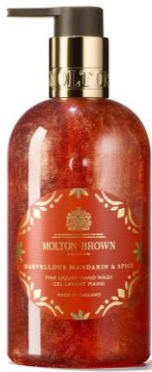
ハンドウォッシュ 300ml/価格：4,400円 (税抜：4,000円)