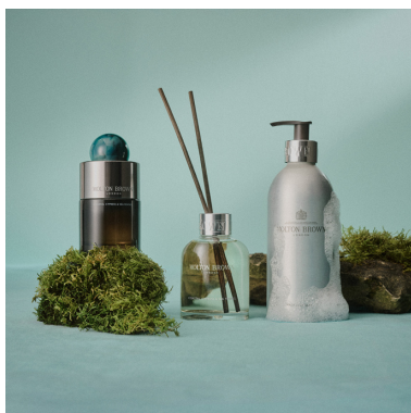
サイプレス&シーフェネル