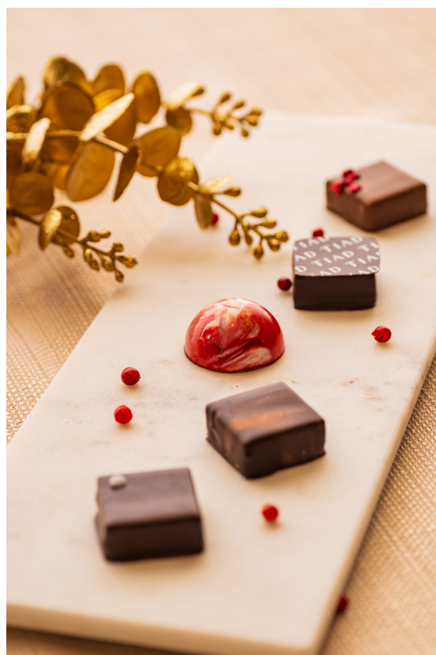
(手前から)ミントビター、オレンジピール&パッションガナッシュ、ピンクペッパー、ビターガナッシュ、苺&ミルク

ドミニカ共和国、アロヨ・トロ地域フルーティーで酸味のあるカカオ。ミルクチョコレートのコクと、シングルビーンズならではの力加オを感じてください。