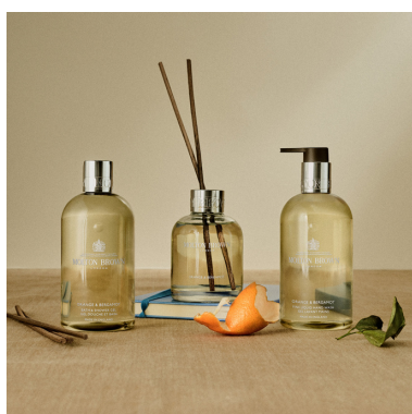
オレンジ&ベルガモット

ローズとルバーブの魅力が詰まった、フローラル・フルーティノートのフレグランス。 華やかなローズ、ジューシーでフルーティなルバーブやユズの繊細なアロマのハーモニー が甘く爽やかに香ります。