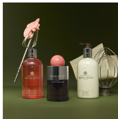
デリシャス ルバーブ&ローズ