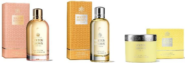
バス&ボディスPECIALケア