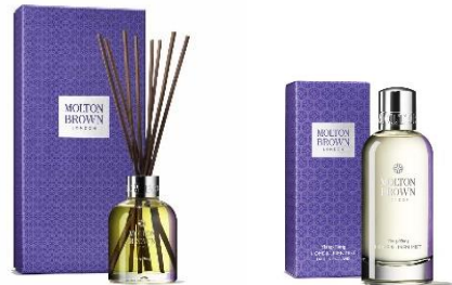
ホームフレグランス