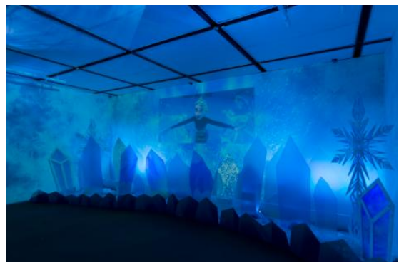
「アナと雪の女王」特別映像シアター