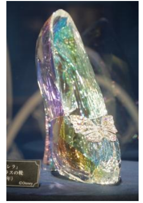
「シンデレラ」小道具 ガラスの靴 (2015年)