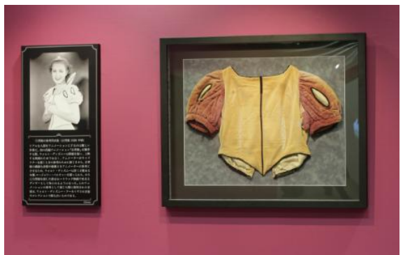
白雪姫の参考用衣装(白雪姫 1936年頃)