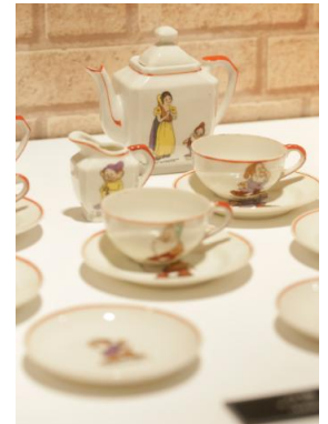
「白雪姫」ティーセット(1938年)

非常に愛情のこもった商品ばかりを作ってきていますし、アンティークなものだけでなく、『アナと雪の女王』や『ベイマックス』など最近の作品に関する商品についても収集しています。」