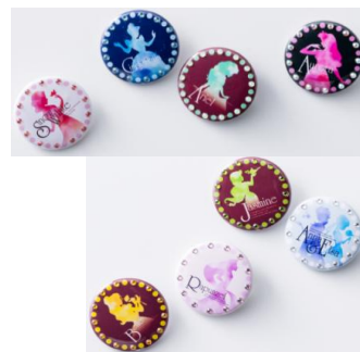
ディズニープリンセス缶バッジ (スワロフスキー®・クリスタル使用) 各500円(税込)