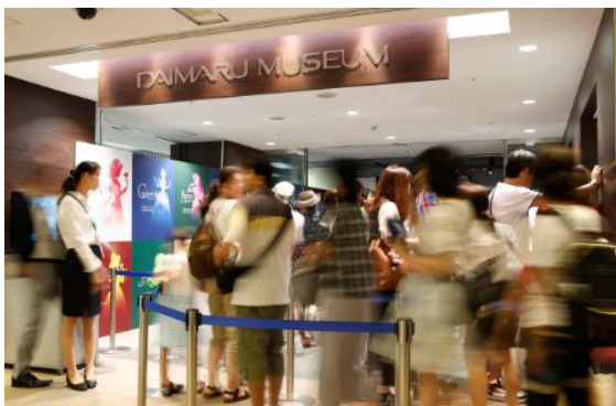
会場オープン時の様子

特に、臨場感あふれる“光と氷のプロジェクション演出”とともに、世界25カ国の言語で歌いつながれた「Let It Go」を観賞できる「アナと雪の女王」特別映像シアターは、その迫力に多くのお客様が惹きつけられていました。同シアターは本展覧会でしか体験できない特別な空間となっております。