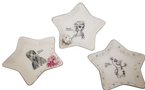
アナ/エルサ/オラフ インテリアトレイ (スワロフスキー®・クリスタル使用) (左)8,640円 (上)10,800円 (右)6,480円(税込)