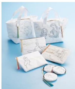
(上)ミニトート 各3,024円(税込) (中)フラットポーチ 各1,944円(税込) (下)コインケース 各1,620円(税込)

ファッション・インテリア雑貨・アクセサリー・文具類など、本展覧会でしか手に入らないオリジナル限定グッズを多数ご用意いたします。