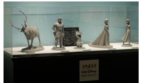
「アナと雪の女王」アニメーション・マケット(2013年)

「展示されているアニメーション・マケットは、『白雪姫』の制作過程でベルチャーが着用したドレスと同じ役割を果たしています。二次元に起こす前に、立体的なオブジェクトを作って参考にしながらアニメーションを作っていくということを現在でも行っています。」