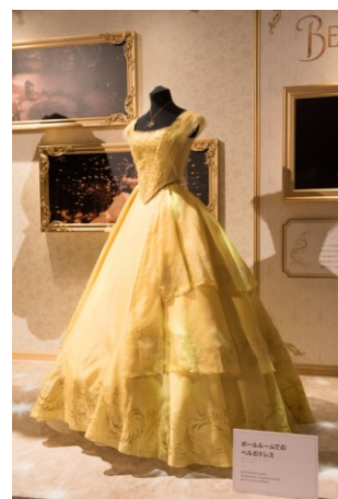
『美女と野獣（2017年）』 ボールルームでのベルのドレス