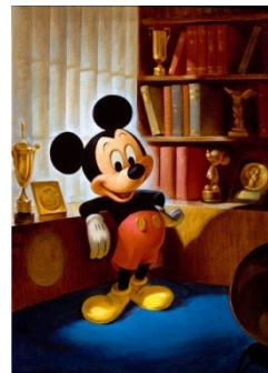
ジョン・ヘンチ画 ミッキーマウスのポートレート（1953年）