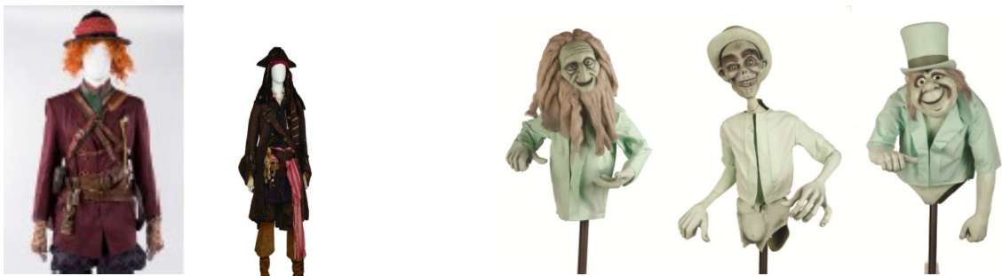
『アリス・イン・ワンダーランド/時間の旅』 『パイレーツ・オブ・カリビアン/最後の海賊』 ジョニー・デップのアイデアが詰まった衣裳と小道具

『アリス・イン・ワンダーランド/時間の旅』、『パイレーツ・オブ・カリビアン/最後の海賊』の両作品からは、ジョニー・デップがこだわりぬいたという衣裳や小道具を展示。他にも、フロリダ ウォルト・ディズニー・ワールド・リゾートの人気アトラクション「ホーンテッド・マンション」で実際に使用された3人のゴーストも登場します。