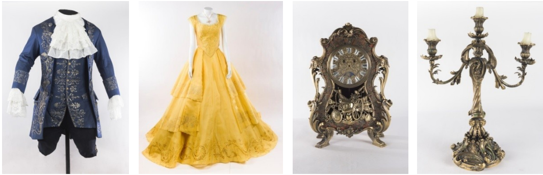
『美女と野獣（2017年）』 ダンスシーンに使用された美しい衣裳と表情に注目のキャラクター・モデル

昨年の大ヒットが記憶に新しい『美女と野獣（2017年）』からは、その美しさが心に残るベルと野獣のダンスシーンの衣裳や、ルミエール、コグスワース、ポット夫人といった個性豊かなキャラクターたちの撮影に使用されたキャラクター・モデルを展示。いまにも動き出すかのような豊かな表情にもご注目ください。