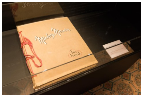
スクラップブック「ミッキーマウス」1954年

※「D23 Expo Japan 2018」チケットの抽選販売はすべて終了しております。