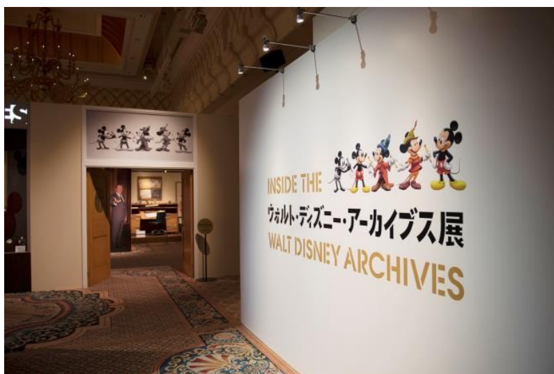
「D23 Expo Japan 2018」の様子

本邦初公開の展覧会「ウォルト・ディズニー・アーカイブス展～ミッキーマウスから続く、未来への物語～」の全国巡回が決定し、その皮切りとして2018年4月11日（水）から5月14日（月）の34日間、大丸梅田店 15階大丸ミュージアム＜梅田＞にて開催いたします。