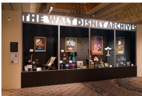
ウォルト・ディズニー・アーカイブスのロビーにある 巨大なショーケースを再現

展覧会の入り口では、米国のアーカイブスのロビーにあるものを再現した巨大なショーケースがゲストを迎えます。このショーケースでは、ミッキーマウスのスクリーンデビュー90周年を記念した特別な展示をご覧いただけます。