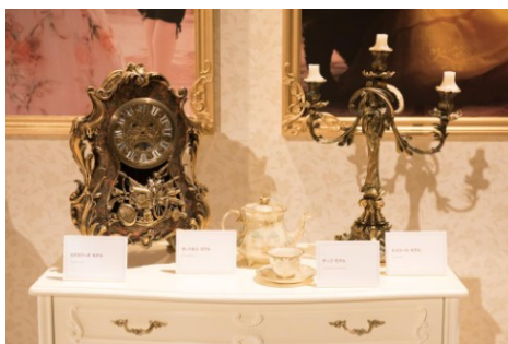
『美女と野獣（2017年）』 撮影に使用されたキャラクター・モデル