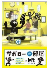
<記念フォトカードイメージ>

ソーシャルメディアプリンター「FOTO fwd (フォトフォワード)」を設置。 会場で撮った写真に指定のハッシュタグ (#サボローの部屋) をつけて Instagram、Twitterにスマートフォンから投稿すると、写真がモニターに リアルタイムで表示され、30秒ほどで記念フォトカードができあがります。 フォトカードのフレームデザインはもちろんサボローです。 ここでしか手に入らない記念の一枚をお持ち帰りいただけます。