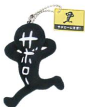
<マスコットキーホルダー>