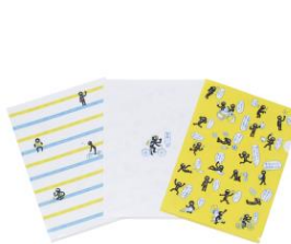
<クリアファイル3種>

学校やオフィスで気軽にお使いいただけるデザイン性の高いアイテムを取り揃えました。 テレビCMやLINEスタンプでは見られない、初登場のサボローのポーズやセリフが満載です。