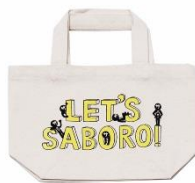
<ミニトートバッグ>