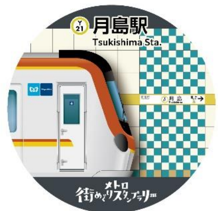
デジタルスタンプ イメージ