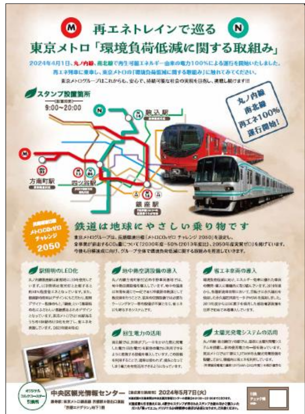
スタンプラリー台紙(裏)