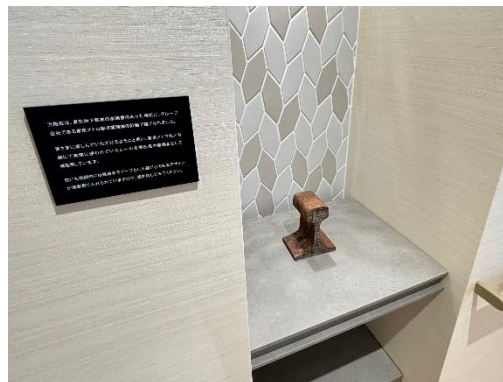
鉄道用レールの館内展示