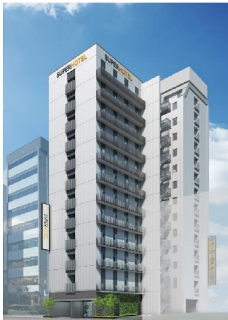
完成イメージ (左手前側)増築棟 (右奥側)既存棟

東京メトログループでは、今後もお客様のニーズや周辺エリア・街の特性に合わせた不動産開発の強化に取り組み、お客様の日常を支える新たな価値の創造に貢献してまいります。