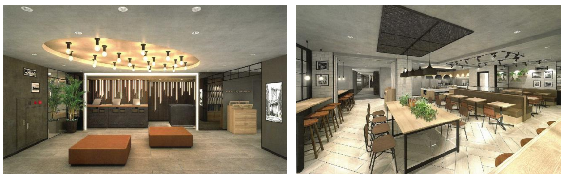
完成イメージ(左側:フロント 右側:ラウンジ)

既存棟に設置していたフロントを増築棟2階に移設し、朝食や、お好みのドリンク作りが楽しめる「ウェルカムバー」を提供するラウンジを拡張いたします。