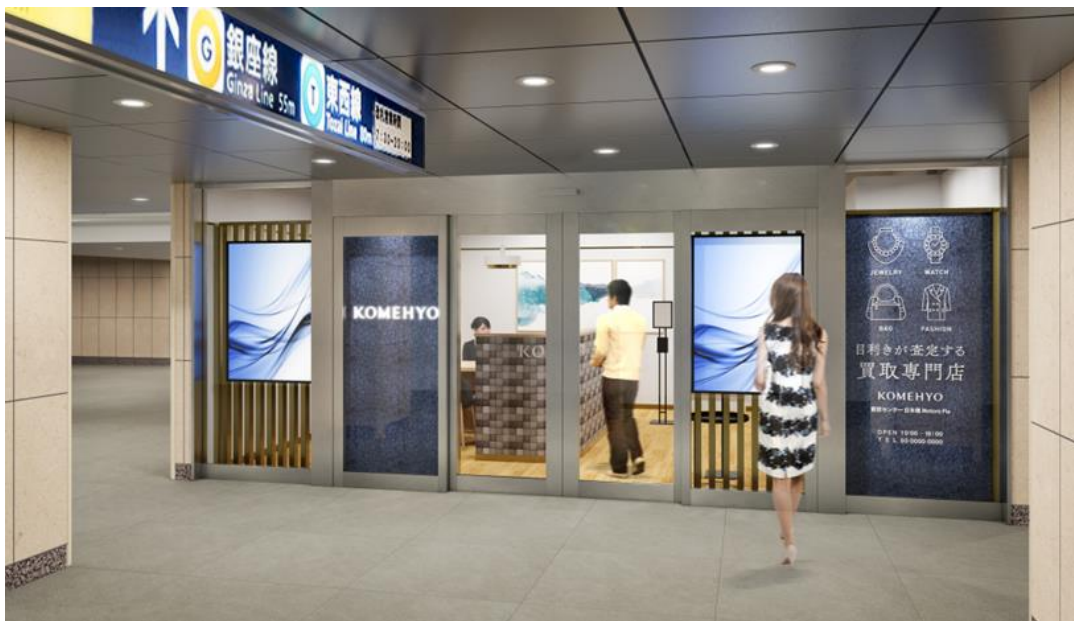
「KOMEHYO 買取センター」完成イメージ