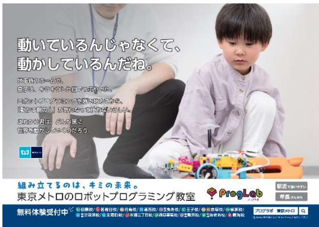
「東京メトロ×プログラボ」

今後も、東京メトロと東京メトロエデュケーショナルは、未来を担う子どもたちや幅広い世代に向けて質の高い教育サービスをお届けし、沿線・地域の魅力度向上と豊かさの創出を目指してまいります。