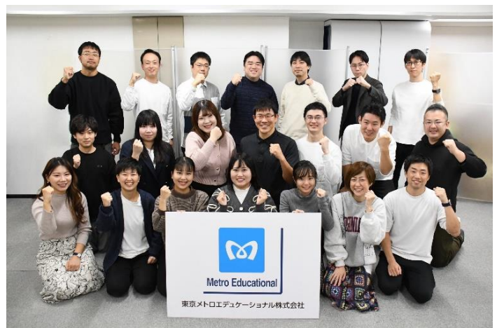
「東京メトロ×プログラボ」の室長と事務局メンバー