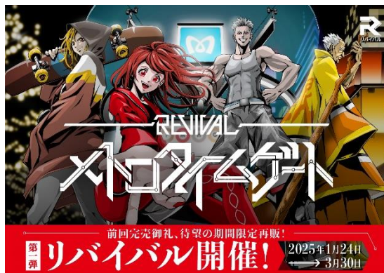
メインビジュアルイメージ

東京メトロでは、街歩きを通して、東京メトロ沿線の魅力に触れ、街を好きになっていただくことで、東京の都市内観光に繋げていく「City Tourism」の取組みを推進していきます。詳細は別紙をご覧ください。