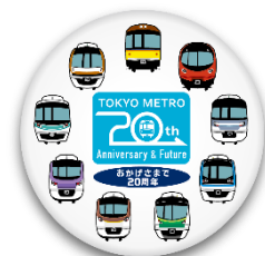
〈缶バッジ(イメージ)〉