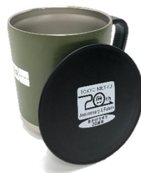
〈マグカップ(イメージ)〉