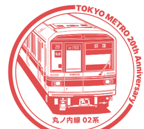
〔丸ノ内線 方南町駅〕