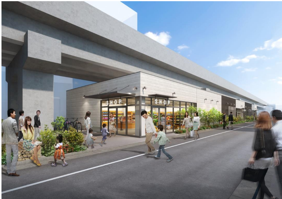
東西線葛西駅西側 高架下施設イメージ

東京メトログループでは、東西線各駅をはじめ、お客様のニーズや周辺店舗・まちのイメージなどに合わせた高架下商業施設のリニューアルや店舗展開を行い、駅まち一体の賑わいのさらなる創出に取り組んでまいります。詳細は別紙のとおりです。