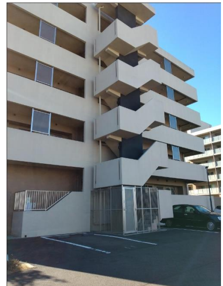
導入予定スペース(イメージ)