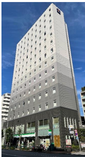
東京メトロ清澄白河ビル (東京メトロ半蔵門線清澄白河駅徒歩1分)