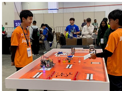
シンガポールでの世界大会の競技に臨む生徒さん